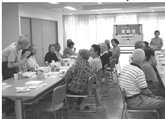
▲グリーンプラザ園生の敬老会