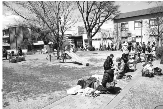
▲虹と風のマルシェのフリーマーケット▲