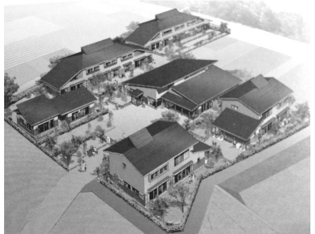
▲児童養護施設完成予定図