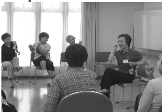
▲介護予防教室 「いきいき元気クラブ～座ってできる予防体操～」