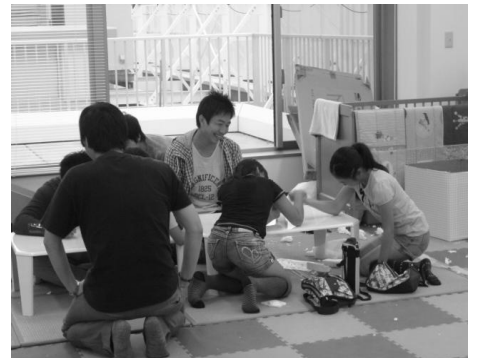
▲学生ボランティアと子ども達

これまで こどもカフェ のボランティアスタッフを続けてきて、わたしは変わることができたと思います。「子どもは苦手」とは思わなくなりましたし、むしろ子ども達との交流を楽しめるようになりました。