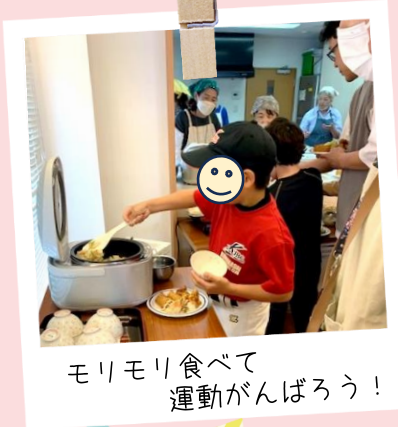
モリモリ食べて 運動がんばろう!