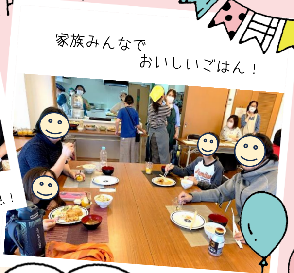
家族みんなで おいしいごはん!

子どもだけでも 家族と一緒にでも OK みんなでごはんを楽しもう♪ 予約してね!