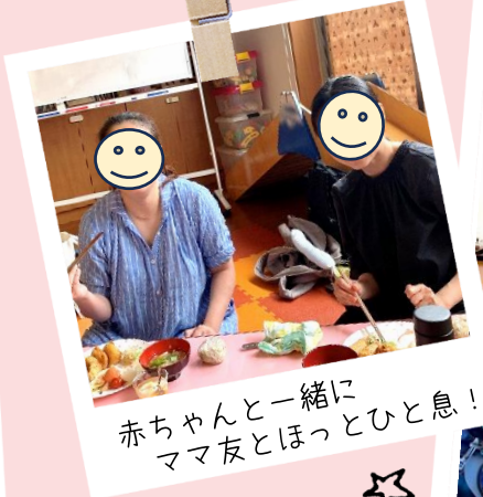
赤ちゃんと一緒に ママ友とほっとひと息!