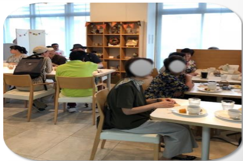
こ～じのう・カフェの様子