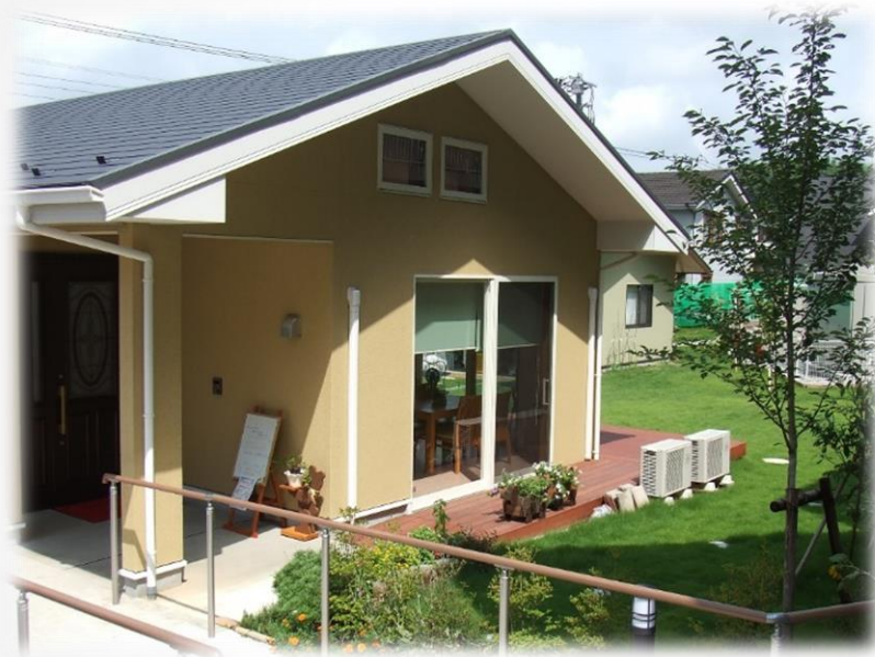
カフェベルダ外観