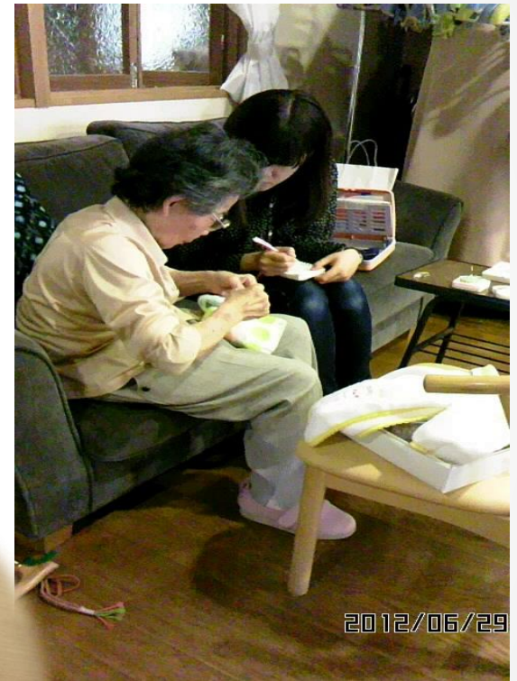
一緒に手作り(施設訪問)