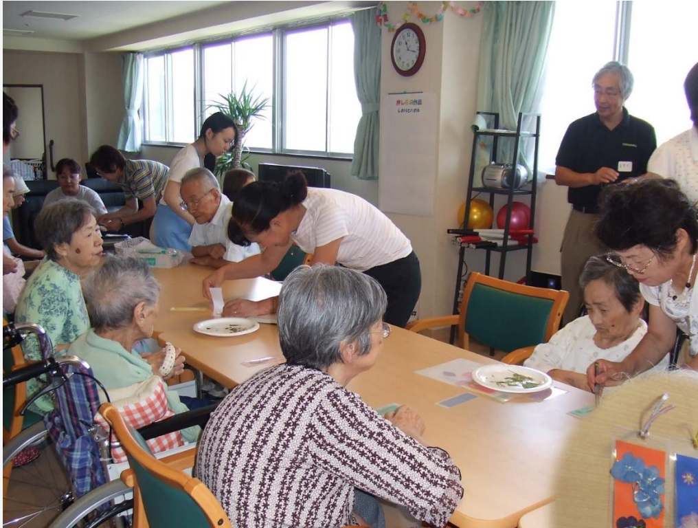
みんなでしおりを手作り(施設訪問)